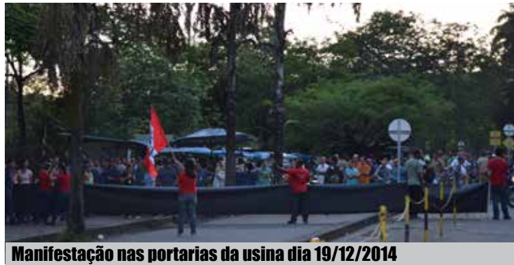
Manifestação nas portarias da usina dia 19/12/2014

É ASSIM, FIRMES E JUNTOS NA LUTA, QUE GARANTIMOS NENHUM DIREITO A MENOS E AVANÇAMOS EM NOSSAS REIVINDICAÇÕES