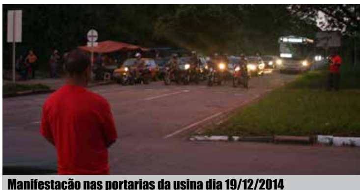
Manifestação nas portarias da usina dia 19/12/2014

O ano de 2014 demonstrou que a USIMINAS não consegue mais frear a luta dos metalúrgicos: as paradas nas portarias, a manifestação do dia 19 que atrasou a produção, a grande participação em todas as assembleias e as denúncias contra a pressão da chefia e as péssimas condições de trabalho são exemplos de que os metalúrgicos se colocaram em movimento. Além disso, o Sindicato já moveu vários processos trabalhistas coletivos para garantir os direitos dos metalúrgicos.